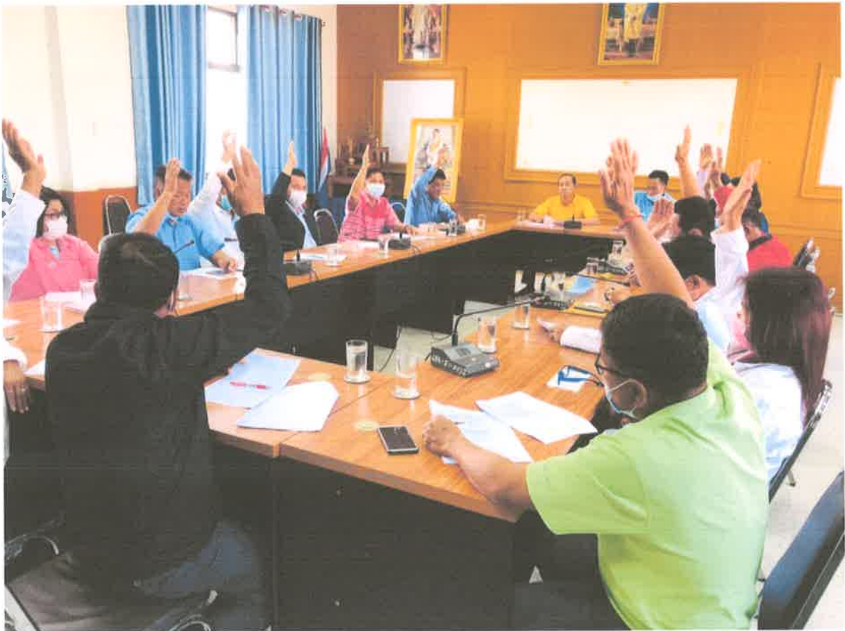
ประชุมคณะกรรมการพัฒนาท้องถิ่น และคณะกรรมการสัดส่วนประชาคมระดับตำบล